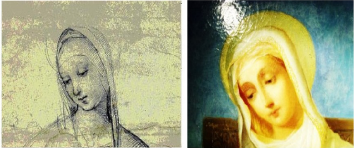
Stilistischer Vergleich Raffael – Renoir

Es war eine sehr ansehnliche Malerei und mit seinen knapp 120 cm Höhe doch sehr imposant. Da ich jedoch zu diesem Zeitpunkt mehr auf Impressionismus aus war ging ich an dem Gemälde achtlos vorüber, ohne es weiter zu beachten und sah mir andere Kunstwerke an.